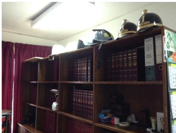
Volúmenes de documentos empastados en el Archivo de la 1ª Compañía de Bomberos de San Bernardo

el presente. Estos documentos dan cuenta de las actividades diarias de la Compañía, incorporando correspondencia y otros documentos administrativos.