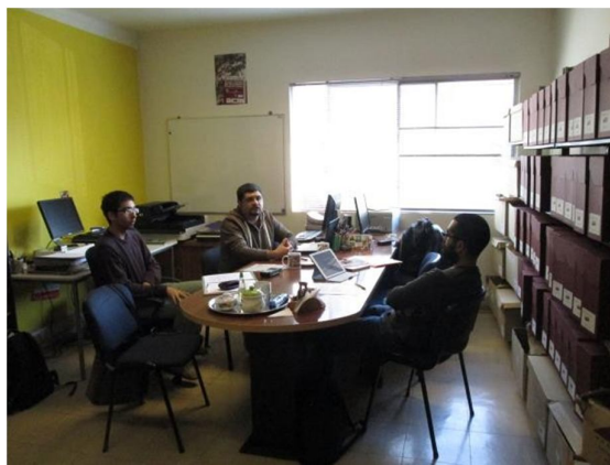
Entrevista en el Archivo y Centro de Documentación FECH

En cuanto a los materiales que resguarda, se trata mayoritariamente de documentos textuales y gráficos en soporte papel, así como también registros sonoros y audiovisuales, que han ingresado al Archivo a través de transferencia interna o por donaciones de ex dirigentes de la Federación. Estos están organizados en tres secciones: Colecciones, Archivo Histórico y Archivo Administrativo. Dichas secciones, junto a la Biblioteca, conforman el Centro de Documentación. Estos documentos permiten dar cuenta de procesos históricos de los que ha participado la Federación, siendo dos ejes importantes las violaciones a los Derechos Humanos durante la Dictadura y el movimiento estudiantil en las últimas décadas.